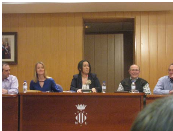
Fotografías acto 22 de Febrero