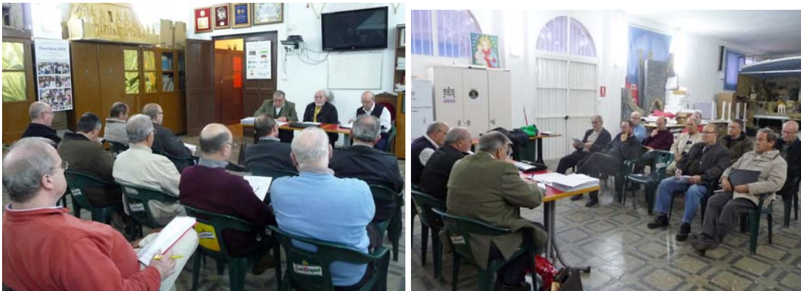
Fotos de los asistentes

Comentar en primer lugar que el 20 de Febrero tuvimos la Asamblea General de socios, sobre la cual se os envió la citación e información correspondiente. La asistencia no fue muy numerosa y es importante vuestra asistencia para que esta directiva se sienta respaldada sobre las acciones a realizar y poder enriquecer la misma con vuestras aportaciones.