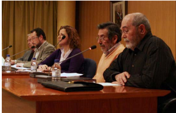
Fotografías acto 15 de febrero